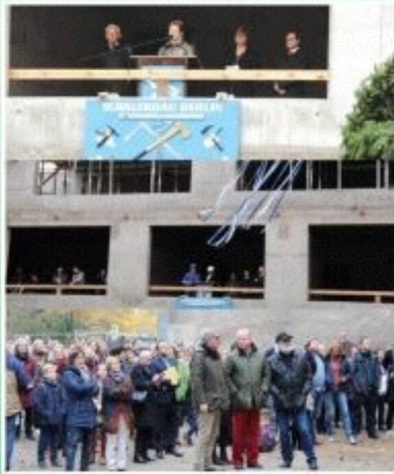
RICHTFEST AM AGD

Unterstützung bei der unterrichtlichen Arbeit und bei schulischen Veranstaltungen sowie Förderung von Schulprojekten